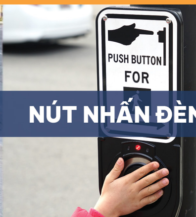
NÚT NHẤN ĐÈN HIỆU