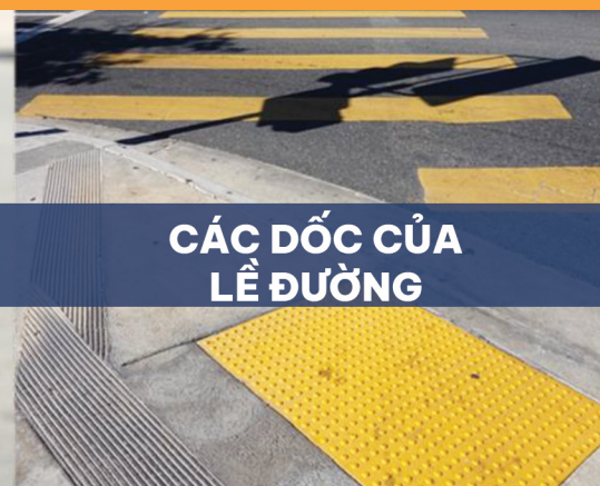
CÁC DỐC CỦA LỀ ĐƯỜNG