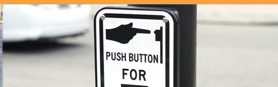
BOTONES DE SEÑALES DE TRÁFICO